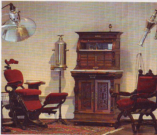
Praxiseinrichtung um 1880, diente bei der Neuverfilmung der Buddenbrooks als Requisite

meter entfernt von Dresden, Leipzig und Chemnitz. Das jetzige 9 000 Quadratmeter große Areal liegt in einer alten Parkanlage, etwa einen Kilometer vom Schloss Colditz entfernt. Der gesamte Komplex – die „Quadrige Dentaria“ – umfasst inzwischen vier Häuser: das Museumsgebäude, die Bibliothek, das Technikum und das Gästehaus.